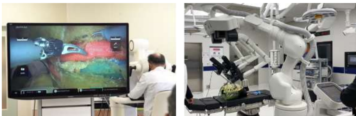
左側:ICCRC 側の「サージョンコックピット」*5 を遠隔操作している様子 右側:MeDIP 側の「オペレーションユニット」*6 で模擬手術をしている様子

本取り組みは、商用 5G と「hinotori™」*1 を用いた「遠隔ロボット手術」の前段階として位置づけられている(図 1)、遠隔にいる熟練のロボット外科医の操作支援を受けながら執刀医が手術支援ロボットを用いて施術する「遠隔ロボット手術支援」(図 2)の実現をターゲットとして、技術的な課題の洗い出しを行い、開発を加速させることを目的としています。