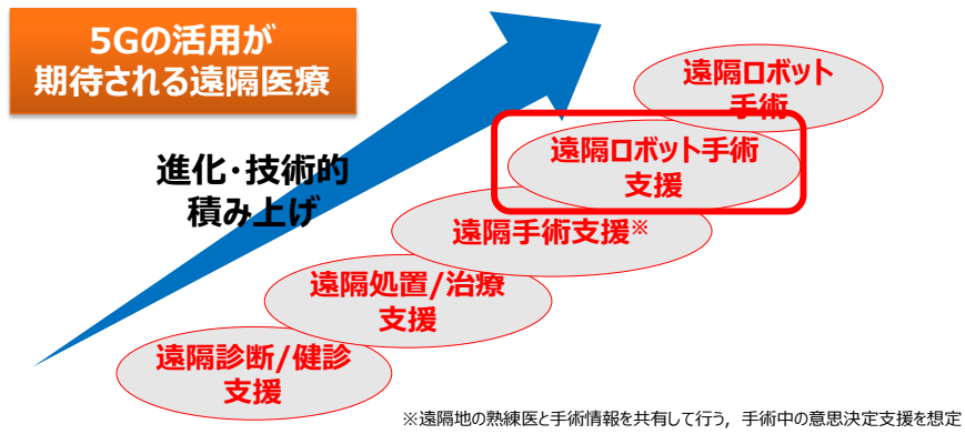
図 1: 遠隔医療におけるステップ